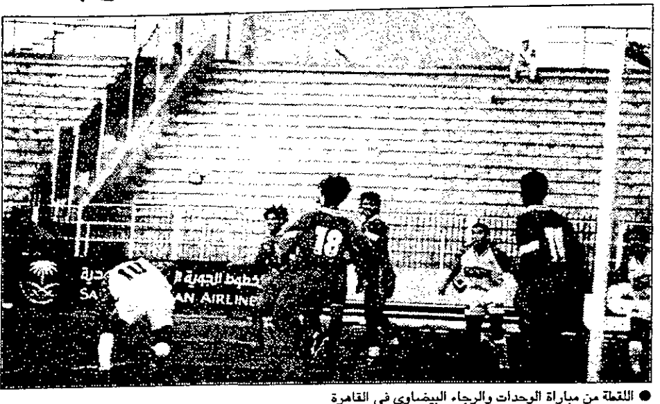
اللقطة من مباراة الوحدات والرجاء البيضاوي في القاهرة

١٦ اذار المقبل بمشاركة الفيضي والاهلي المصري واولميك خريبكة المغربي وسوف يلعب الرجاء مع الفيضي يوم ١٤ اذار بينما يلعب الفيضي مباراة الافتتاح مع اهلي مصر بطل العرب الذي تعادل مع المنصورة في اول مباراة له بعد تنويجه بطل لعرب. هذا وعقب خسارته امام الاهلي المصري ٣/١ في نهائي البطولة العربية استبدل الرجاء محربه الروسي فيكتور بمرهه الجديد الجزائري رايح سعدان. كان الرجاء البيضاوي فاز ٤/صفر على الوحدات في اطار بطولة الاندية العربية.